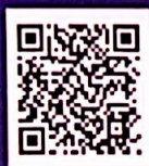
益海嘉里招聘 微博