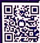
益海嘉里招聘 哔哩哔哩