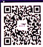
益海嘉里招聘 公众号